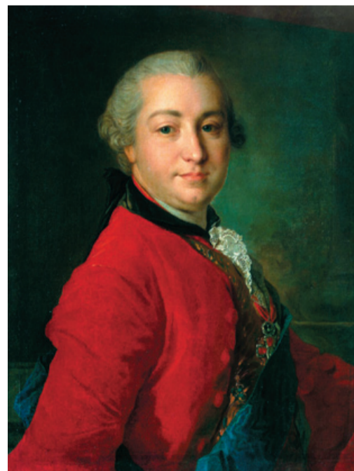
Рис. 1. И. И. Шувалов (1717–1797) – первый русский ученый-естествоиспытатель, Русский государственный деятель, ученый-энциклопедист, академик, меценат основатель Московского университета.

Труд М. В. Ломоносова написан как письмо графу И. И. Шувалову – русскому государственному деятелю, основателю Московского университета и Академии художников, фавориту императрицы Елизаветы Петровны.