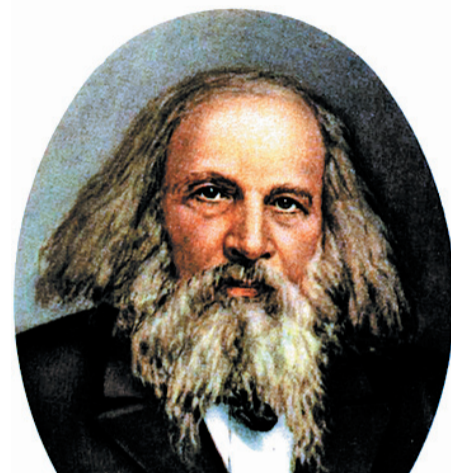
Рис 4. Д. И. Менделеев (1834–1907) – русский ученый-энциклопедист: химик, физик, метролог, экономист, геолог, нефтяник, педагог.

В этом плане мы сошлемся на труды выдающегося русского ученого Дмитрия Ивановича Менделеева.