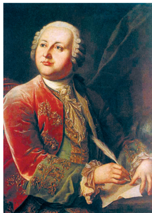
Рис. 2. М. В. Ломоносов (1711–1765)

Михаил Васильевич приводил конкретные примеры, за счет чего может быть приращение народа Российского. Рамки статьи не позволяют приводить много примеров, но на двух, имеющих определенное значение и в наше время, мы остановимся, а конкретно на неравных браках в возрастном аспекте и монашестве.