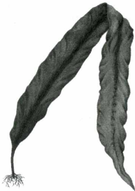
Рисунок 1. Бурая морская водоросль ламинария

год произрастания ламинария образует лентообразную пластину-слоевище длиной от 1 до 12 метров ( рисунок 1 ). Организованы добыча и промышленная переработка ламинарии.